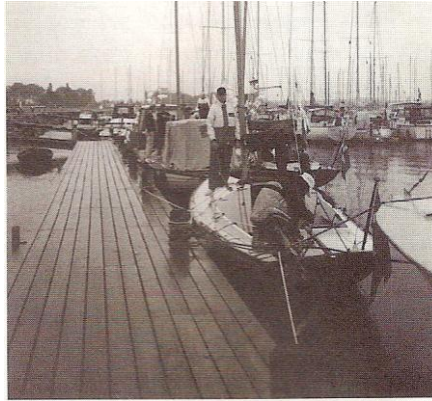
Kerteminde Havn i gråvejr og regn

omkring klokken 1300. Dan kontaktede mig på VHF-eren. Han ville gerne besøge os, så han blev også sat på turneringsholdet trods det brækkede ben. KERTEMINDE OPEN sluttede sent på eftermiddagen - med HOLD 11 som vindere - Husk lige det. Så var der også slik og sodavand til alle. "SLIKPØSEN" blev' tømt.