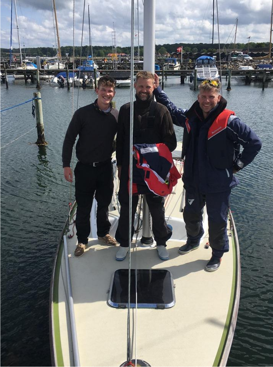
Alpi med besætning, kort efter målgang